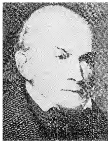
John Quincy Adams

5) John Quincy (1767—1848) 6-sis JAV prezidentas, John A. sūnus. Diplomatinę karjerą pradėjo Olandijoje, buvo pasiuntiniu Prūsijoje ir Rusijoje. 1814 Gente sudarė taikos sutartį su Anglija ir ėjo Didž. Britanijoje JAV atstovo pareigas. 1817—1825 užsienių sekretorius. Monroe doktrinos vykdytojas. 1825—1829 JAV prezidentas. Kovojo prieš vergiją. 1874—